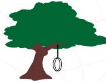
(d) Sistem yang sebenarnya diinginkan oleh pemakai