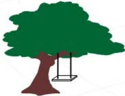
(c) Pemrogram melakukan penyederhanaan