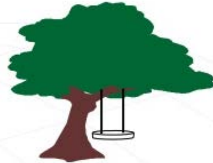
(b) Kebutuhan pemakai yang cukup direalisasikan menurut analis sistem